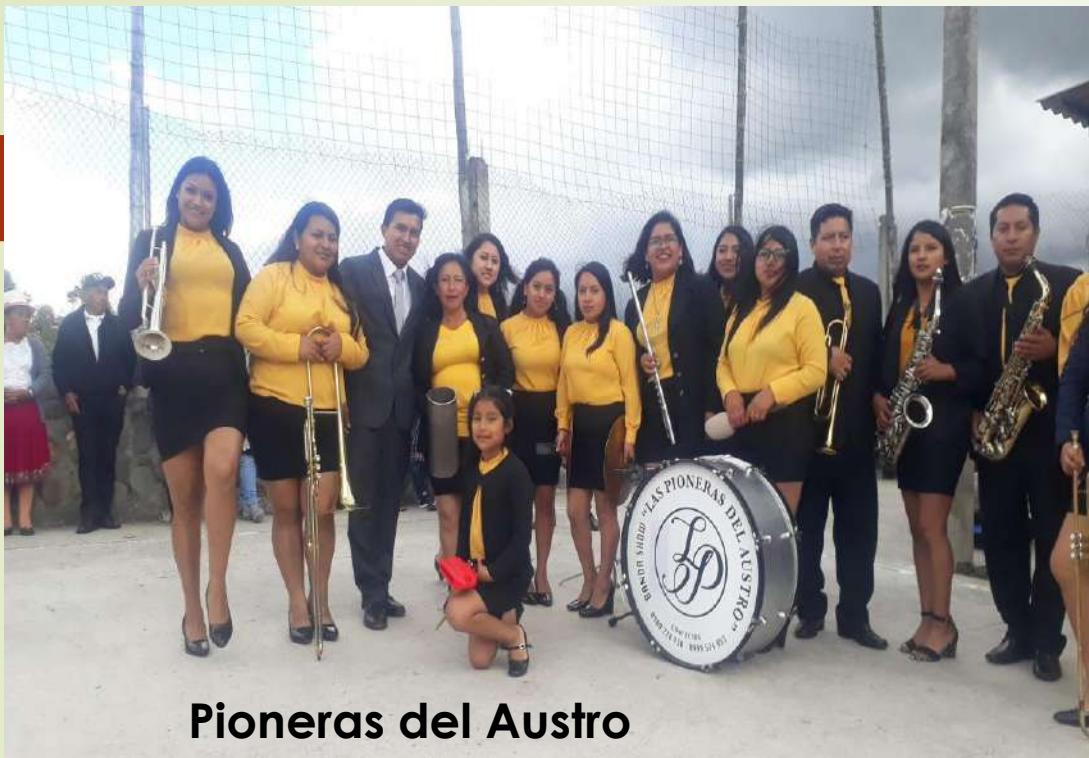
Pioneras del Austral