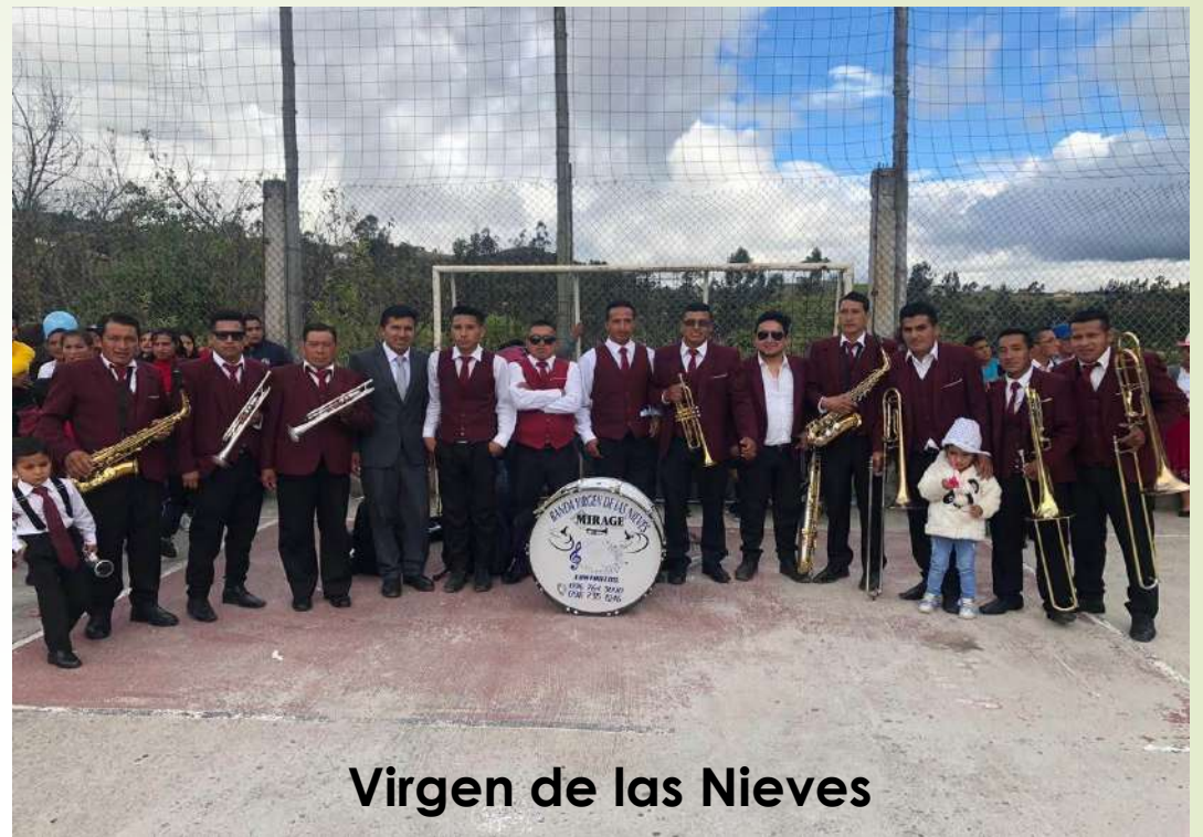
Virgen de las Nieves